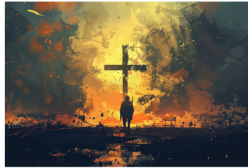
L'espérance à l'ombre de l'Apocalypse