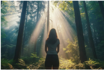
Jésus : l'aujourd'hui de notre espérance

« La foi que j'aime le mieux, dit Dieu, c'est l'espérance. » Pierre Loiseau , auteur du troisième texte vient nous dire, tout comme l'écrivain, que la foi du croyant et de la croyante, doit se nourrir d'espérance, « l'espérance dispose du pouvoir de jeter une lumière nouvelle, d'ouvrir la porte à une perspective plus rassurante sur ce qui peut advenir. Elle brille comme une étoile dans le ciel de notre monde obscurci par les nuages de la désespérance ».