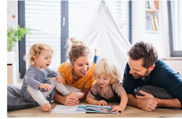
Où loges-tu, humble espérance ?