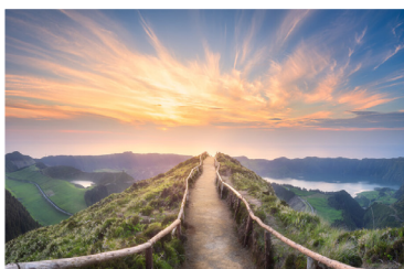
Vers une Église synodale Luc Benoît