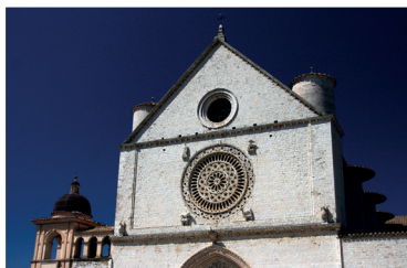
Trois, deux, un... Action ! Mgr Christian Rodembourg

Le dernier texte, signé par Pierrette Bertrand , nous met en présence des jeunes, chrétiens et musulmans, qui se sont engagés dans une rencontre pour « identifier leurs rêves et les défis auxquels ils font face et préciser les valeurs spirituelles auxquelles « ils se réfèrent pour devenir de bons citoyens ». Filles et garçons, jeunes catholiques et musulmans, ils découvrent la fraternité qui les unit dans le respect, les différences qui les divisent, ils font le choix de bâtir des ponts plutôt que d'ériger des murs qui séparent. L'avenir s'ouvre sur « les rencontres interreligieuses pour un vivre ensemble harmonieux ».