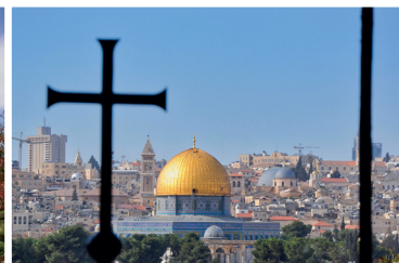
Des jeunes chrétiens et musulmans se rencontrent Pierrette Bertrand, ofsj