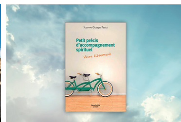
AU CŒUR DES MOTS Gaston Sauvé Petit précis d'accompagnement spirituel