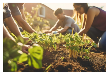
L'audace de l'espérance Normand Provencher